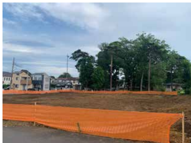
旧第二保育園跡地の現状

さらに、公園内には高低差があるため、新たな土留めの設置も必要となる。設計や施工費については、市の負担となり課題と捉えている。