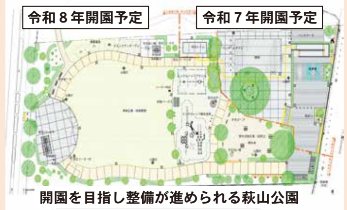
開園を目指し整備が進められる萩山公園

萩山公園が一日も早く、子どもから大人まで誰もが楽しみ、魅力ある公園に生まれ変わるよう、今後も取り組んでまいります。